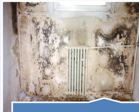
Odgrzybianie powierzchni mineralnych