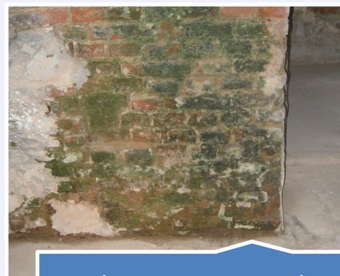
Zabezpieczanie przed zagrzybieniem wtórnym