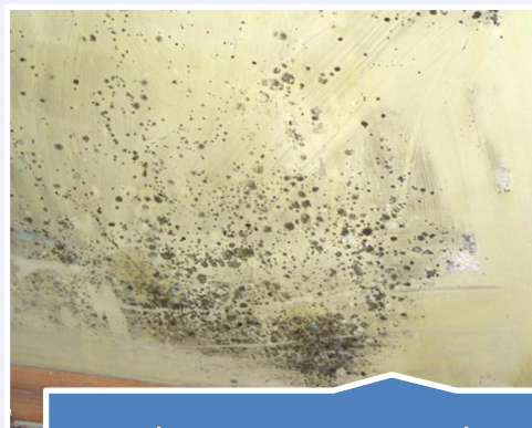
Zabezpieczanie przed zagrzybieniem pierwotnym